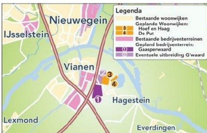
Plannen als geheel

Aan de oostkant van de A27 liggen bij het dorpje Hagestein diverse nog open polders waar nu grootse plannen voor zijn. De plannen voor bedrijventerrein Gaasperwaard (vlak langs de A27) zijn in volle gang, maar de nieuwe woonwijk in de polder Hoef en Haag geeft ook problemen bij de provincie (zie 29: Vianen – woningbouw polder Hoef en Haag).