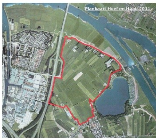
Figuur 1. Zoekgebied Haag en Hoef tussen Vianen en Hagestein.

Aan de oostkant van de A27 liggen bij het dorpje Hagestein nog prachtige polders als Overhoeven en Grote Hagen waar talloze weidevogels nestelen. In dat gebied dat nu omgedoopt is tot polder Hoef en Haag, wil de gemeente Vianen woningen bouwen. Dit gebied ligt echter buiten de rode contour, waarbuiten geen woningbouw is toegestaan. Oorspronkelijk ging het om de bouw van 760 woningen, terwijl daar volgens het migratiesaldo-nul principe ( onderzoek van RIGO in opdracht van Milieudefensie, NMU en Zuid-Hollandse Milieufederatie) hooguit 630 woningen zijn toegestaan. Inmiddels gaat het ook om een uitbreidingsmogelijkheid naar 1850 woningen.