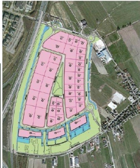
Plan Gaasperwaard eind 2009