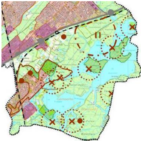
Molenbiotopen in het gebied

Overige zaken die vragen oproepen is dat in de 'Verkenningen' genoemde twee molenbiotopen - met beperkingen voor nieuwe bebouwing binnen 400 meter - en de ligging in het Groene Hart zijn bij de latere uitwerking weinig meer aan bod komen. Het lijkt er al met al op dat vrij selectief met informatie is omgegaan, zowel intern bij de gemeente als naar bewoners en andere belanghebbenden.