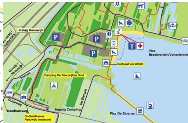
Situatie (zonder Infocentrum De Hartloper)